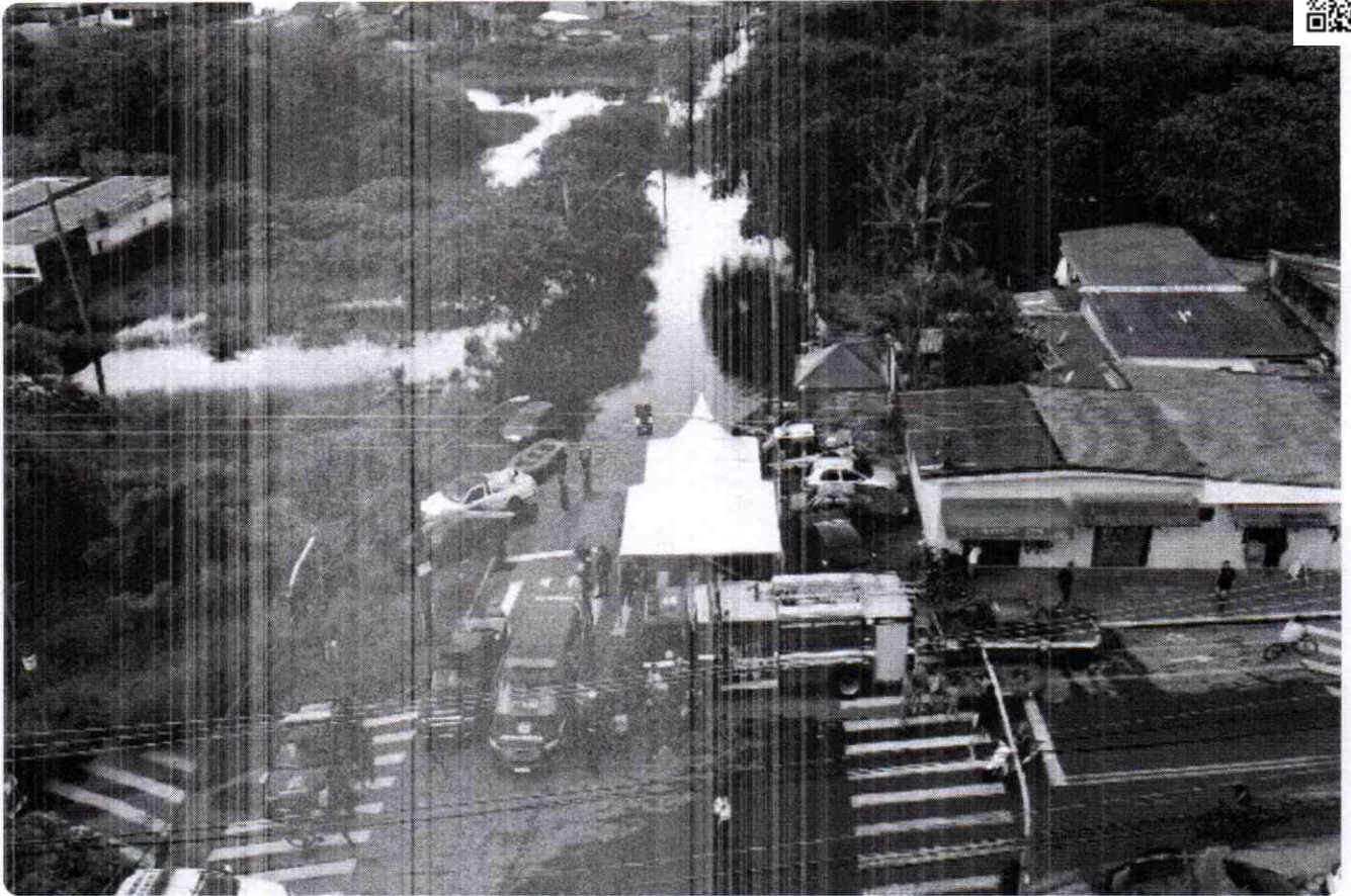
Posto de comando de ações montado para combater às chuvas em Peruíbe, SP

Peruíbe foi o município mais afetado pelas chuvas e decretou situação de emergência. A cidade conta com três abrigos que atendem 290 pessoas.