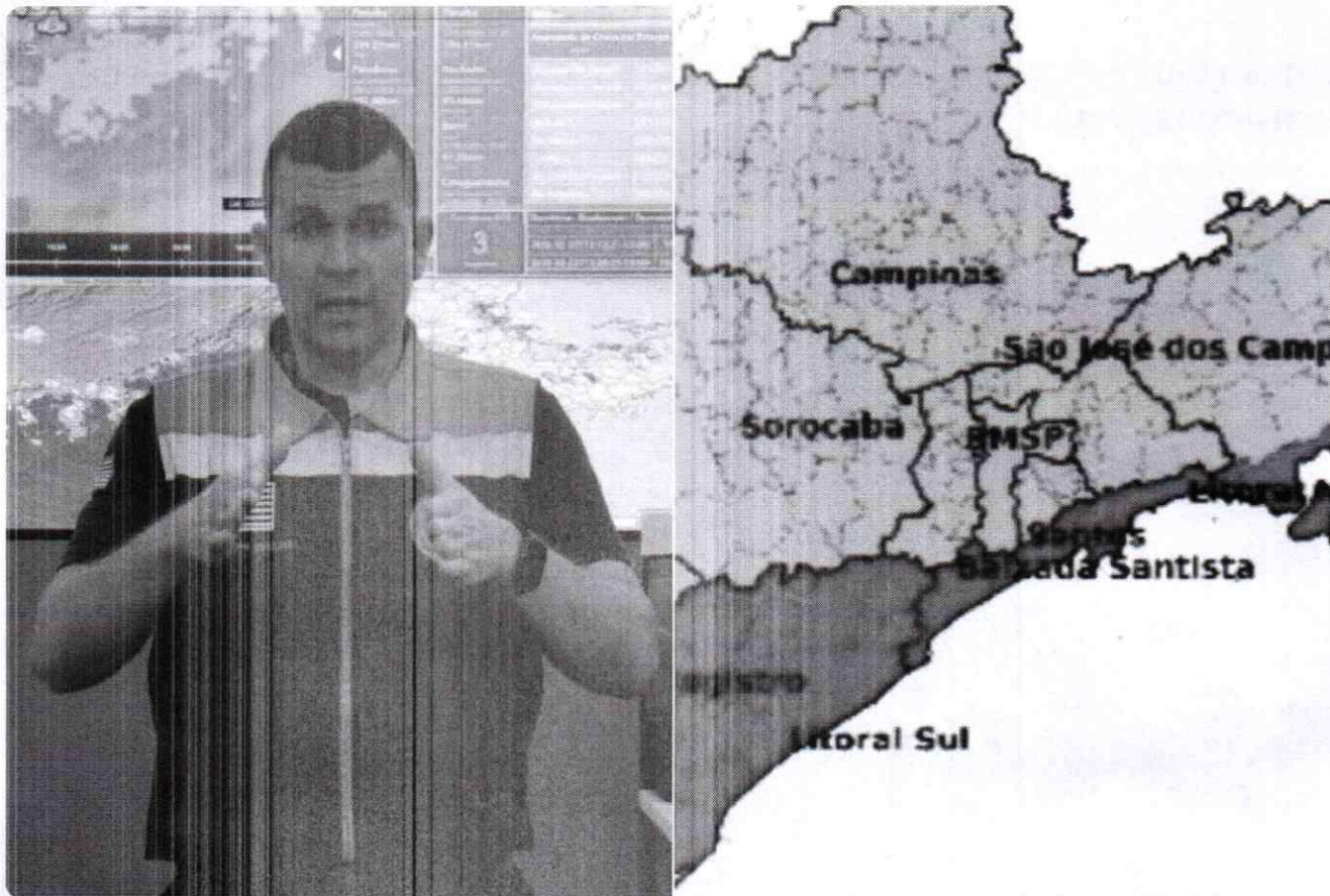
Defesa Civil Estadual emitiu alerta sobre chuvas na Baixada Santista

Em nota, a Defesa Civil informou que a passagem de uma frente fria cria condições para chuva contínua no estado entre terça-feira (24) e sexta-feira (27), com momentos de chuva forte na faixa litorânea.