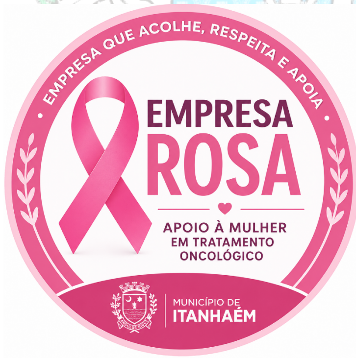
Imagem representada por inteligência artificial

o laço rosa central; a inscrição “EMPRESA ROSA”; a identificação institucional do Município de Itanhaém.